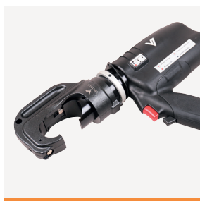
VBT13-LC Batteripresse 130 kN 06