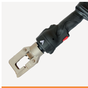
VBT51S Batteripresse 50 kN 04