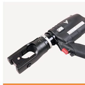
VBT13-U Batteripresse 130 kN 05