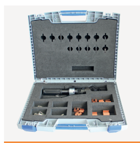
Sortiments- skrin Installasjon 11