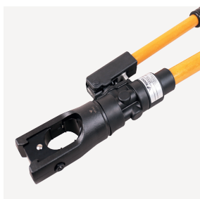
VT13-U Presstang 130 kN 08