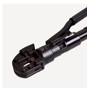
VTC24 Kutter 24mm 15