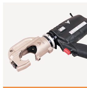
VBT13-C Batteripresse 130kN 07