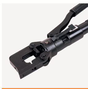
VT51 Presstang 50 kN 10

Batteriverktøyene har innbygget sikkerhetsstart, det vil si at en må trykke på startknappen 2 ganger for å starte pressingen. Standard Bosch batterier benyttes på batteripressene. Service utføres på Skedsmokorset.