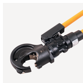
VT13-C Presstang 130 kN 09