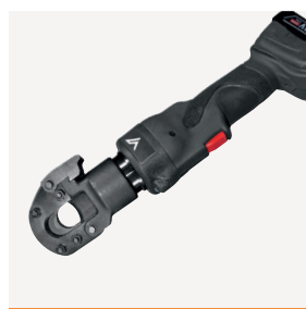
VBTC24 Batterikutter 24mm 13