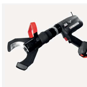
VBTC65 Batterikutter ø65 14