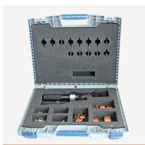
Sortiments- skrin E-verk 12